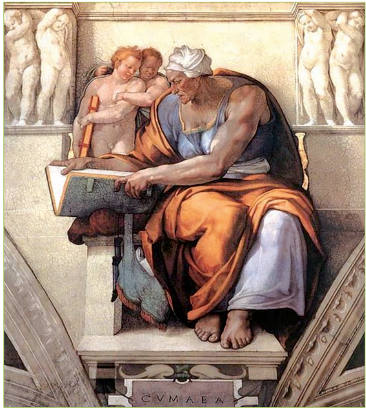
Sibilla Cumana, Michelangelo Buonarroti, Cappella Sistina

Con gli anni, gli occhi e la memoria si indeboliscono, ma si impara a vedere più lontano. Per questo i bambini amano la compagnia degli anziani: non sono stressati e distratti dal superfluo come i loro genitori; sanno raccontare le storie, quelle vere, che parlano all'anima, e comprendono l'importanza dei sogni