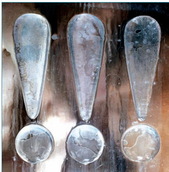
La copertina dell'ultimo album dei Chk Chk Chk