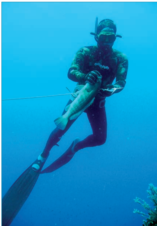
A destra un particolare dopo la cattura, a sinistra un momento della discesa

Il notevole impegno fisico richiesto e il fatto che essa sia condotta in un ambiente ostile all'uomo, limitano il numero di praticanti, ma c'è da rilevare che con l'affermarsi di particolari tecniche di pesca, come l'aspetto e l'agguato, che premiano la difficoltà della singola cattura o quella di esemplari di mole, attirano un sempre crescente numero di praticanti facendo sì che essa si configuri come una forma di prelievo ittico tra le più affascinanti e, al contempo, particolarmente avvincenti. <