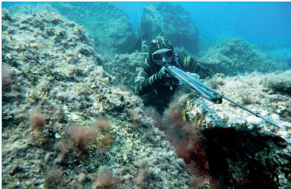
A fianco particolare durante una battuta di pesca in apnea

L A PESCA IN APNEA, è una attività di prelievo ittico attuata con la tecnica dell'immersione senza l'ausilio di attrezzature autonome di respirazione. Inizialmente è stata esercitata dall'uomo essenzialmente per procurarsi il cibo ma, successivamente, è servita anche per raccogliere conchiglie per colorare i tessuti (la famosa porpora delle vesti degli antichi romani), spugne per la pulizia e perle per scambi commerciali. La sua evoluzione nella forma moderna, tuttavia, è avvenuta nell'ultimo secolo grazie alle innovazioni nelle tecniche e nelle attrezzature subacquee. Storicamente denominata "pesca subacquea", la trasformazione nell'attuale nome è stata fatta per sottolinearne il valore sportivo e la sostanziale differenza rispetto a quella effettuata, negli anni passati, con gli autorespiratori, oggi vietati per l'esercizio di questa attività. L'estrema sportività di tale disciplina è dovuta al fatto che l'immersione si svolge trattenendo il respiro e, in queste condizioni, si