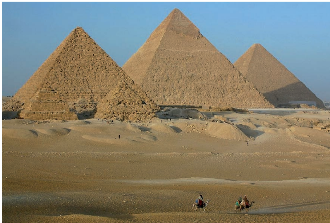
Le Piramidi del Cairo in Egitto

G LI ASTRONOMI E GLI ARCHITETTI EGIZIANI collaborarono nella costruzione della piramide di Cheope in modo mirabile.